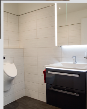
Funktional und chic. Ein WC in unserem Neubau.

Zugegeben, auf den ersten Blick ist die Idee „Heizungstausch im Winter“ schon etwas verwegen und lässt manchen Hausbesitzer möglicherweise in Gedanken frösteln. Doch wir geben ein Versprechen ab: Mit guter Projektplanung und unseren praktischen Heizstrahlern bleibt es in der Wohnung warm, während im Heizraum „Alt gegen Neu“ getauscht wird. Ein weiterer Pluspunkt, die Preiserhöhungen der Kesselhersteller, meist zum Frühjahr, können Sie sich sparen. ♦