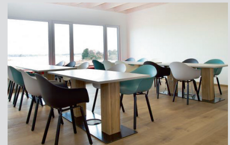
Hell, freundlich und mit besonderer Atmosphäre. Unser Mitarbeiter-Bereich für Besprechungen, Brotzeit...

Überall wird über Fachkräftemangel und Nachwuchsprobleme gejammert. Auch wir sind davon betroffen, auch deshalb weil z.B. einer unserer langjährigen Kundendienstmonteure leider krankheitsbedingt für Monate ausfällt. Aber wir tun auch was – indem wir auf junge Menschen zugehen und Ausbildungsplätze anbieten. Dazu kommt: wir haben attraktive und moderne Arbeitsplätze, sind ein tolles Team! Deshalb: Wir freuen uns immer über Verstärkung! ♦