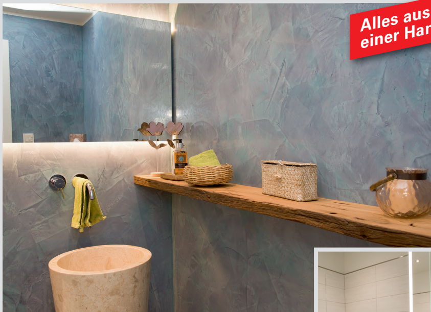
Kundenwünsche werden wahr. Wer realisiert's? Na klar, der Pfab!

und pflegeleicht wird. Speziell auch, wenn es um bodenebene Duschen geht. Gerne koordinieren wir auch alle begleitenden Gewerke wie Elektriker, Fliesenleger etc. Sprechen Sie mit uns, wenn Sie Ihr altes Bad modernisieren oder umbauen möchten. ♦